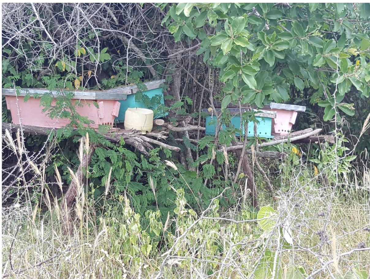
De bijenkasten gesponsord oa door stichting Devon